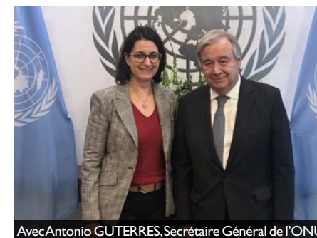
Avec Antonio GUTERRES, Secrétaire Général de l'ONU

Du 6 au 9 novembre, en tant que vice-présidente de la Commission des Affaires Etrangères, j'ai conduit une délégation de parlementaires à la 74 ème assemblée générale des Nations Unies , à New-York. L'ONU regroupe 193 Etats, avec pour objectifs le maintien de la paix et la sécurité internationale. Onze auditions menées sur place, dont celle d'Antonio GUTERRES, le secrétaire général. Multilatéralisme, crise au Sahel, cybersécurité, Brexit : de nombreux sujets abordés, pour une voix de la France qui porte, par son Gouvernement, mais aussi par ses parlementaires.