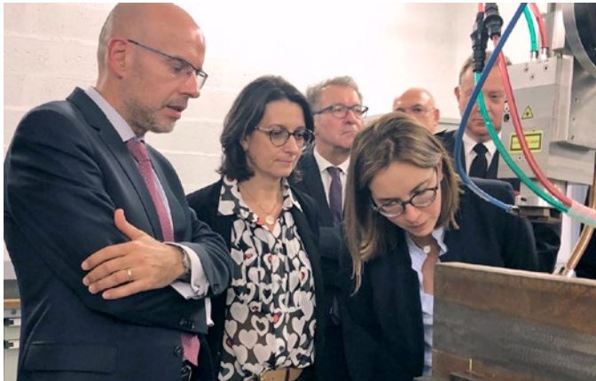
14 octobre 2019 Visite d'Amélie DE MONTCHALIN, Secrétaire d'État aux Affaires Européennes