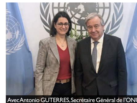
Avec Antonio GUTERRES, Secrétaire Général de l'ONU

Du 6 au 9 novembre, en tant que vice-présidente de la Commission des Affaires Etrangères, j'ai conduit une délégation de parlementaires à la 74 ème assemblée générale des Nations Unies , à New-York. L'ONU regroupe 193 Etats, avec pour objectifs le maintien de la paix et la sécurité internationale. Onze auditions menées sur place, dont celle d'Antonio GUTERRES, le secrétaire général. Multilatéralisme, crise au Sahel, cybersécurité, Brexit : de nombreux sujets abordés, pour une voix de la France qui porte, par son Gouvernement, mais aussi par ses parlementaires.