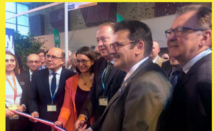
17 octobre 2019, Inauguration du Salon à l'Envers