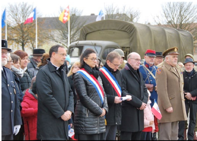
Commémoration de l'Armistice du 11 novembre 1918 à Bousse