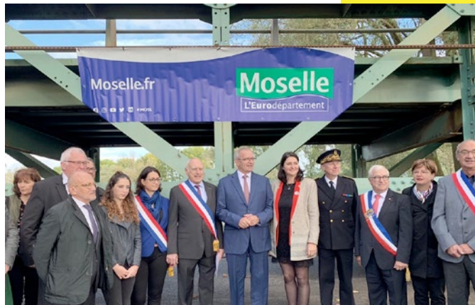
29 septembre 2019 Cérémonie de départ des baleines du Pont de Cattenom vers le Calvados