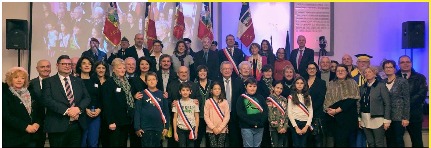
16 novembre 2019, Signature de l'acte de jumelage entre Thionville et Urbana (Illinois, Etats-Unis)